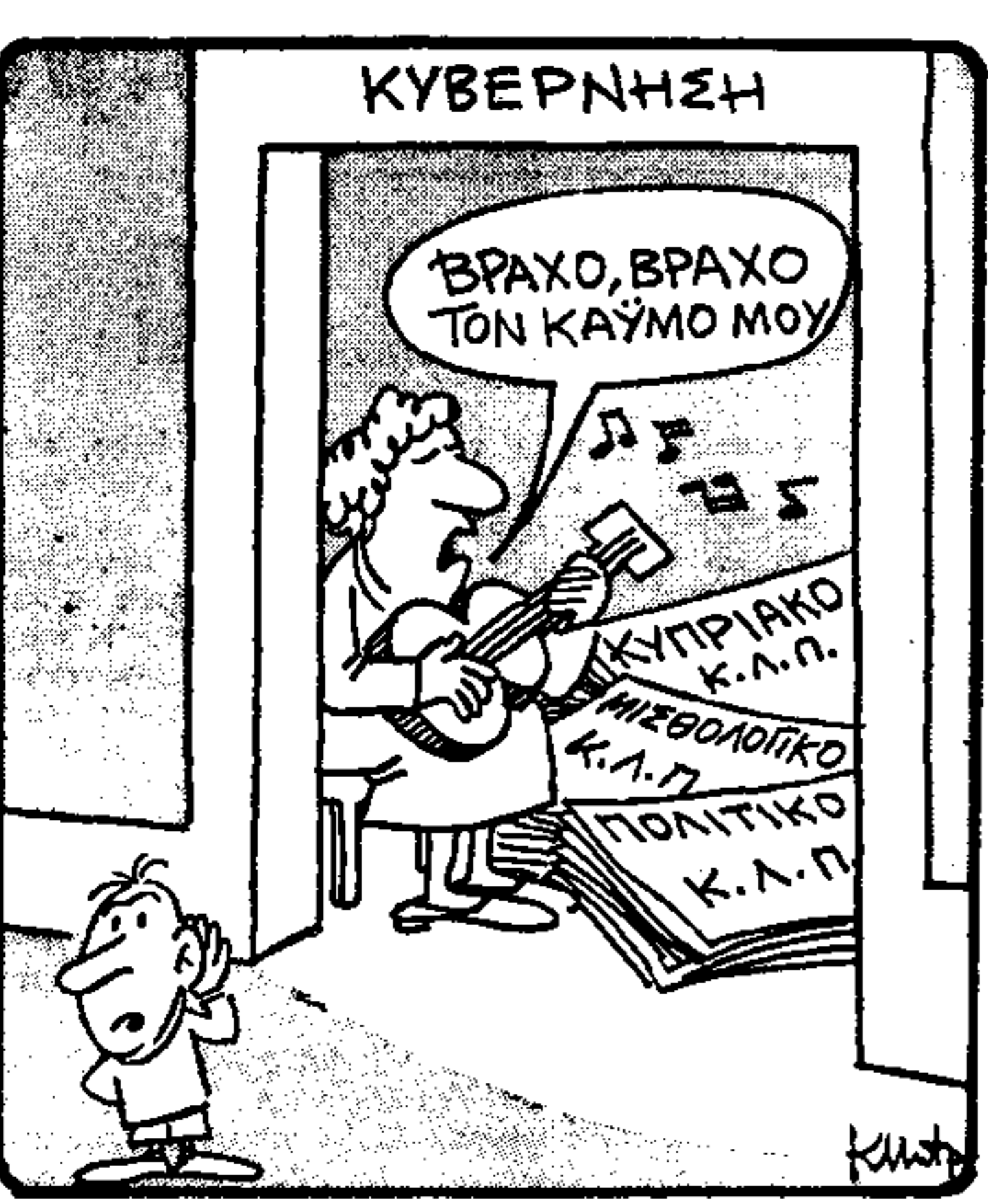
Μπα; Έπετρατί ο Θεοδωράκης;